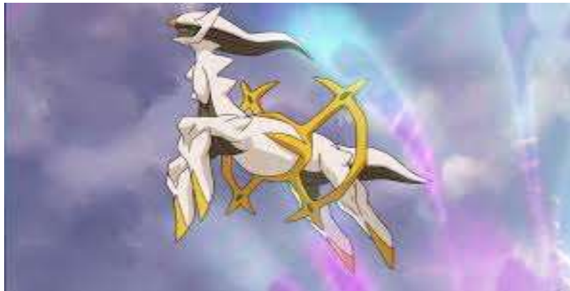
Έλενα Μυράτση

Έχει σωματική διάπλαση που μαΐζει με ιπποειδή. Είναι ένα χιονισμένο μαλλί Ροκέμπον με κάθετες μαυρισμένες ραβδώσεις στη χείτη, την ουρά και το κάτω μέρος. Έχει μακρά χείτη και ένα χρυσό σημάδι στο μέτωπό του με πράσινα μάτια και έντονη λαμπερή κόκκινη ίριδα. Έχει μακρύ λαιμό με λευκή γούνα που μαΐζει με ππερύγιο και δύο προεξοχές από το λαιμό του και δύο μυτερά αυτιά. Το Arceus έχει μακριά σφγμένα πόδια, χρυσές σπλές και ουρά. Έχει μια χρυσή ρόδα που μαΐζει με σταυρό γύρω από την κοιλιά του με τέσσερα πράσινα πετράδια προσαρτημένα στην άκρη. Τα μάτια του αλλάζουν χρώμα μαζί με τον τροχό και τις σπλές του ανάλογα με την πλάκα που ανήζει. Το Arceus είναι το πιο ισχυρό Ροκέμπον στο Ροκέμπον σύμπαν και είναι γνωστό ότι είναι ο δημιουργός του ίδιου του Ροκέμπον world. Αλλάζει τον τύπο του κραώντας την πλάκα ή τον ειδικό τύπο Z-Crystal. Σύμφωνα με τους θρύλους, είναι ο πλάρχος του Creation Trio και των Lake Guardians. Αποκλείει τη δύναμη να αναδημιουργήσει, να εξαφανίσει και να σταματήσει το χρόνο. Αυτό το Ροκέμπον είναι επίσης γνωστό ως το 'Alpha Ροκέμπον'.